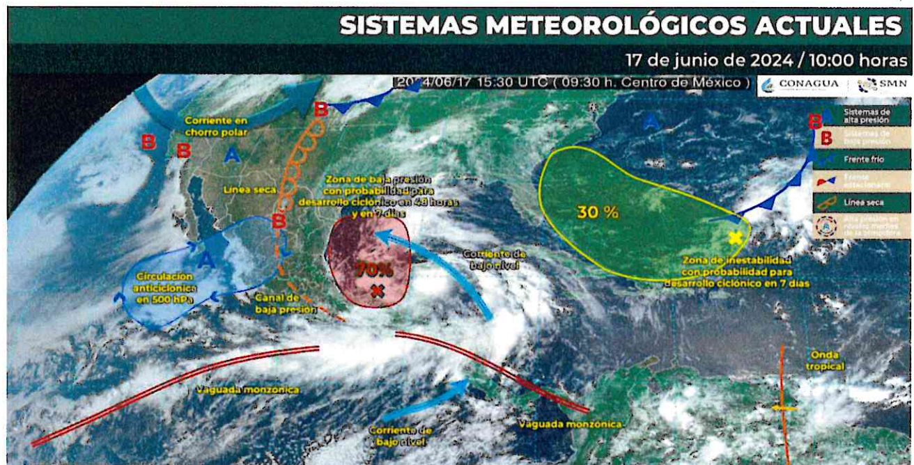
Zona de baja presión con probabilidad de desarrollo ciclónico, vaguada monzónica, línea seca y canal de baja presión.

Nota: Las lluvias pronosticadas a partir del rango de fuertes (25 a 50 mm), podrían originar incremento en los niveles de ríos y arroyos, deslaves e inundaciones en zonas bajas de los estados indicados.